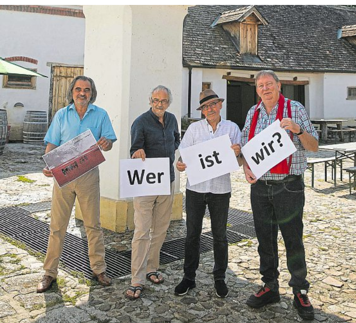
Künstler arbeiten heuer in Oslip an der Frage „Wer ist wir?“