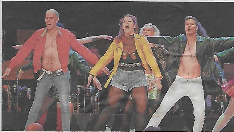
Ins Kulturzentrum Oberschützen weicht heuer das Güssinger Faschingskabarett aus. Gespielt und gesungen wird am 2., 3. und 4. Feber. Musical Güssing